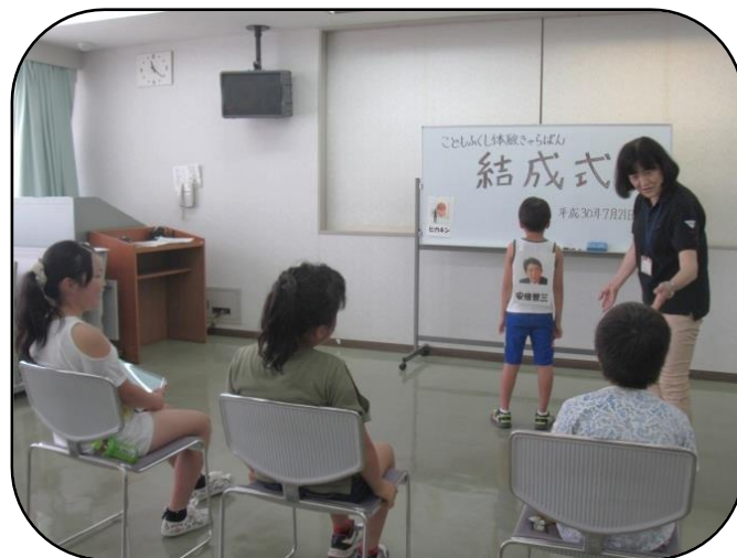
仲良くなろうゲーム