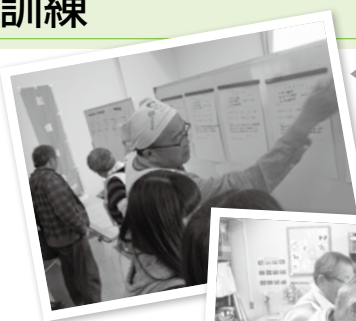
◀災害ボランティアセンターでの活動紹介の様子

平成30年1月20日に、駆けつけ役のボランティアのみなさまにご協力いただき、災害ボランティアコーディネーターの方々と災害ボランティアセンターの立ち上げ訓練を実施しました。当日、駆けつけ役のボランティアのみなさまは、館内に用意したボランティアコーナーで、防災・減災に関する体験を行いました。