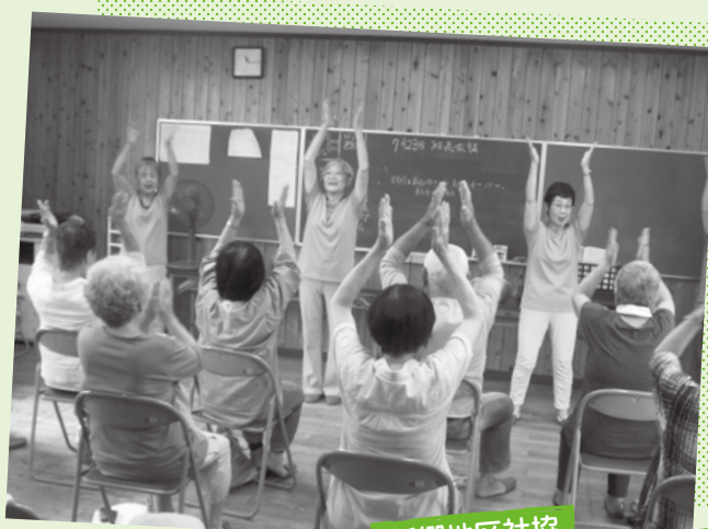
新郷地区社協 いきいきサロンの様子

地域の乳幼児とその保護者を対象に、おもちゃなどで遊んだり子育て支援をする場です。