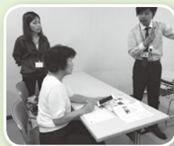
スマートフォン教室