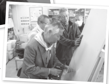
▶家具転倒防止用下地さがし