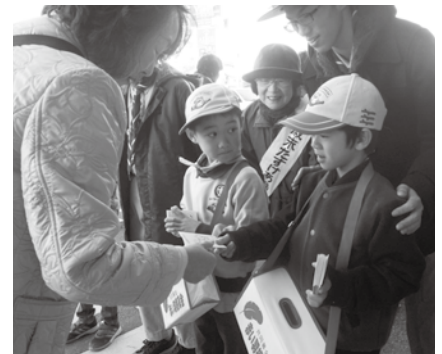
歳末たすけあい募金(街頭)